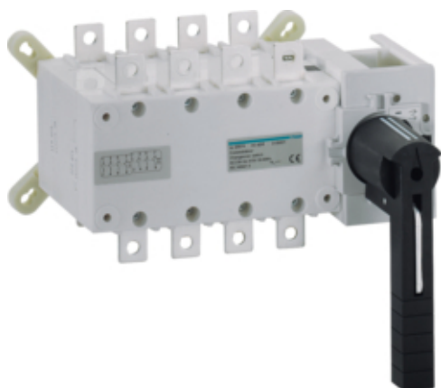
Commutat 4P 250A